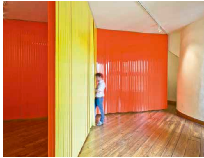
GELBORANGE, 2011 Installation, Kunstverein Bochum

Führungen an den Donnerstagen 24. Jan. und 21. Feb., jew. 19 Uhr und an den Sonntagen 17. Feb. und 3. März, jew. 15 Uhr.